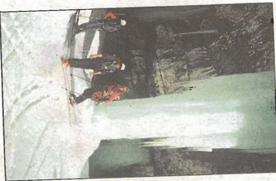
Natur pur: Gefrorene Wasserfälle.