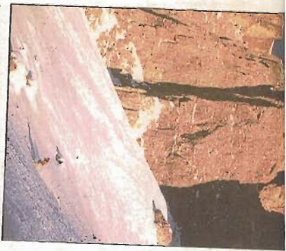
Macht der Berge: Die Sella-Türme.