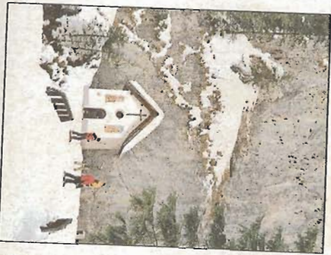
Das hat was: Kapelle im Canyon.