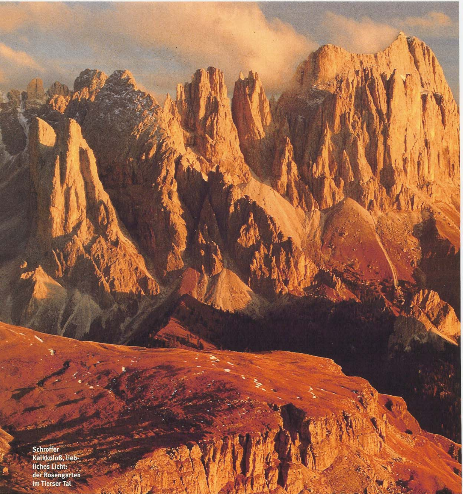
Schroffer Kalkköloß, lieb- liches Licht: der Rosengarten im Tierser Tal