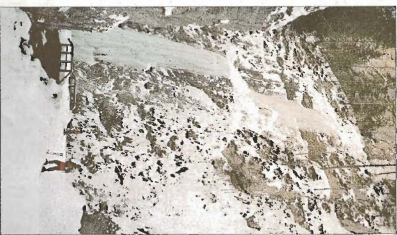
Eisige Schönheiten entlang des Zielwegs durch die Sorraie di Sottoguda.

Skisafari in den Dolomiten, das sind rund 60 000 Höhenmeter. Pistenpaß und Lebenslust pur. Nur eines droht jedem, der einmal mitmacht: erhöhte Suchtfähigkeit.