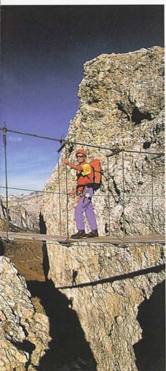
Abb. links unten: Schatten- und Schaukelspiel auf dem Pisciadu-Klettersteig in der Sellagruppe.

darunter: Die Sonklarspitze bei Sonnenaufgang. Unsere Route führt in vier Tagen vom Gletscher zum Wein.