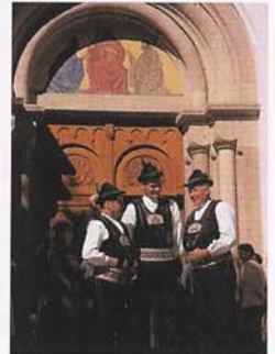
Abb. oben: Blick auf St. Peter im Grödnertal.