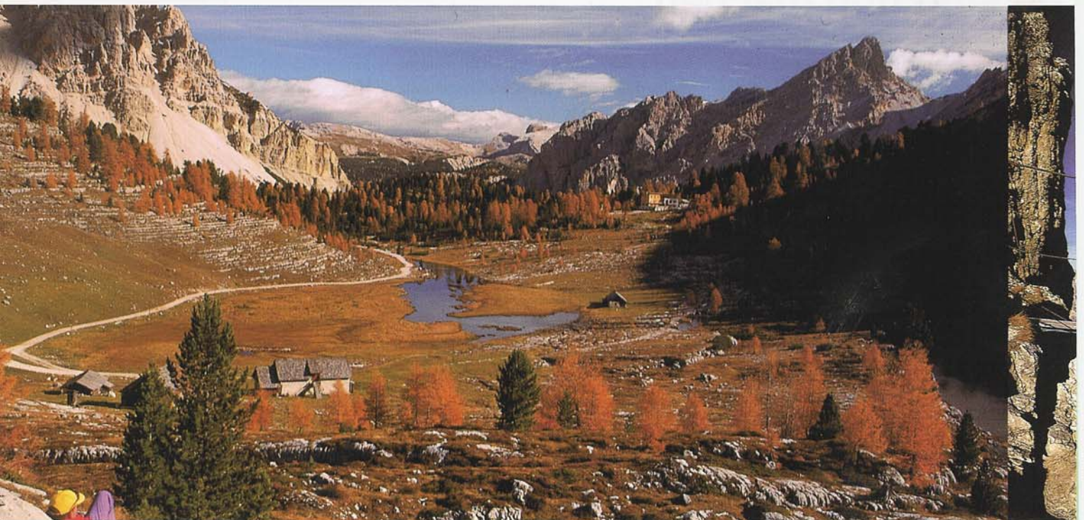
Abb. unten: Es gibt Plätze, die vergißt Du nie. Hier die Fanesalm – kostbare Stille.

Er darf bleiben, wir werden weiterziehen!